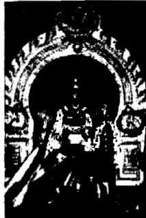
ஸ்ரீ லக்ஷ்மி நரசிம்மர் - டுவரசன்கூப்பம்

உக்ரம் வீரம் மஹாவிஷ்ணும் ஜவலந்தம் ஸர்வதோமுகம் | ந்ருஸிம்ஹம் பீஷெணம் புத்ரம் ம்ருத்யும்ருத்யும் நமாம்யஹம் ||