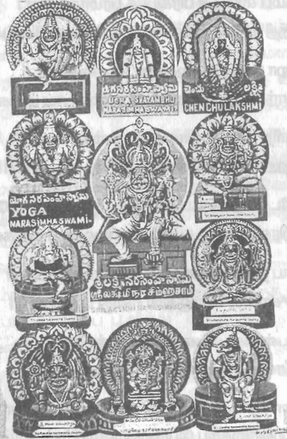
அஹோபிலம் நவ நரசிம்மப் பெருமாள்