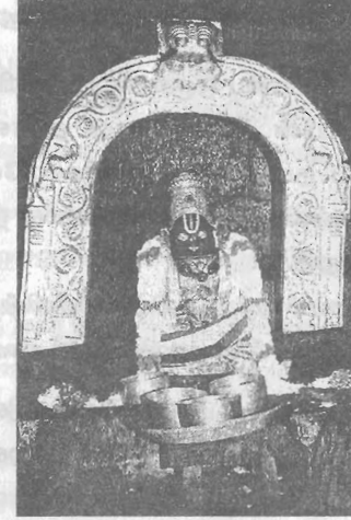
உக்கிர சுயம்பு நரசிம்மப்பெருமாள் (அஹோபிலம்)

வ்ருத்தோத்புல்ல விஸாலாக்கூடம் விபக்கூக்கூடிய தீக்ஷிதம் | நிநாததீரஸ்த விஸ்வாண்டம் விஷ்ணுமுகீரம் நமாம்யஹம் || 1